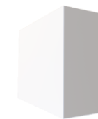
Box 2/2 Boîte

Water Tank / Réservoir Code : O-LOFT-T Size / Dimension 17" x 8" x 17" G.W. : 15 Kg N.W. : 14 Kg